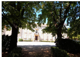
Sieste et jeux