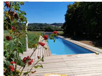
Pas que pour les dauphins !