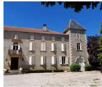
Ou par là !