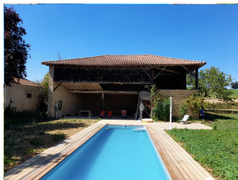
Terrasse apéro et barbecue